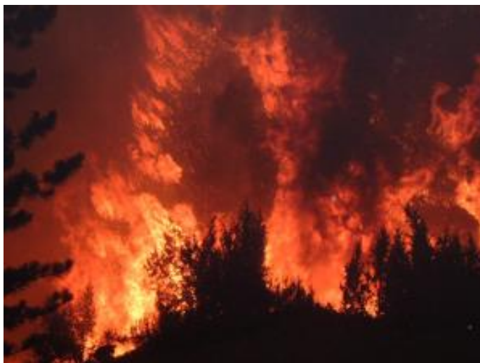
kiterjedt nagy tűz

A legfontosabb azonban a megelőzés! Az alábbi veszélyes helyzetek fordulhatnak elő a mindennapokban.